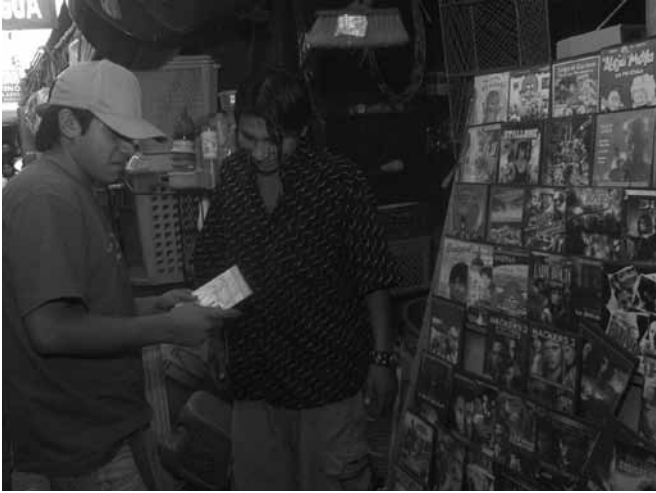
Reducción gradual de la tasa del IGV y del IPM de 19% a 16%, pues esta, al ser alta, promueve la informalidad y la evasión tributaria.

reales con el objetivo de reducir el pago de sus impuestos.