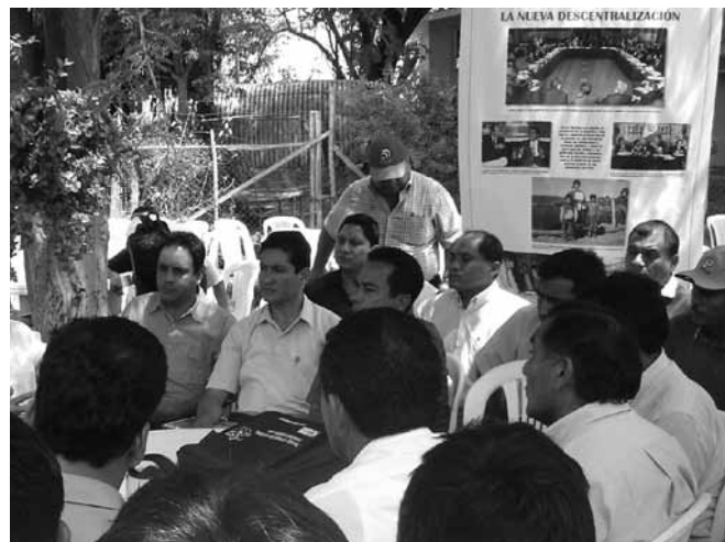
El documento propone el establecimiento de un Pacto Fiscal, es decir, un acuerdo entre gobierno, partidos políticos, gremios empresariales, trabajadores y sociedad civil en general para acordar cómo obtener, distribuir, utilizar y controlar la utilización de los recursos públicos.

Objetivo 2: Disminución de las pérdidas de eficiencia que generan los impuestos, mediante la reducción