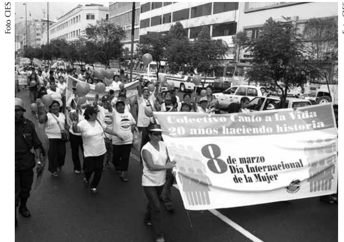
Mientras el MIMDES no tenga de manera expresa la competencia rectora para la lucha contra la violencia hacia la mujer, se desaprovecharán recursos que podrían utilizarse para ampliar la cobertura, mejorar la calidad de la atención e invertir en prevención antes que seguir atendiendo las consecuencias.