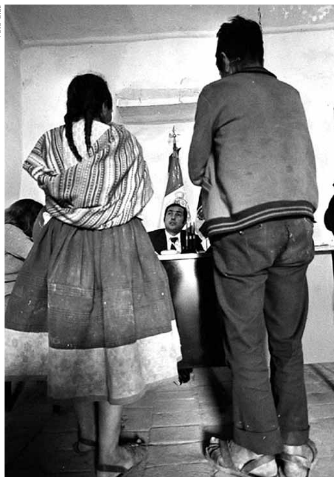
La Comisión de la Verdad y Reconciliación señala que la violencia sexual en sus distintas modalidades fue utilizada como una forma de intimidación y castigo.