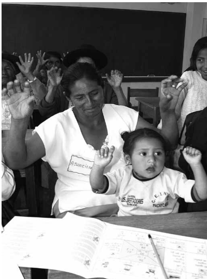
No hay una estrategia para el desarrollo infantil temprano, la mejora de los aprendizajes luego del segundo grado, o la reducción de las brechas que afectan a las poblaciones con necesidades educativas especiales (estudiantes indígenas o con discapacidad).

Llevado a escala nacional el desarrollo de modelos de acompañamiento pedagógico e intercambio de experiencias entre docentes para promover mejores aprendizajes; se ha triplicado la cobertura de educación inicial formal para niños de 3 a 5 años de edad; asimismo se ha establecido la Evaluación Censal de Estudiantes (ECE) para medir los logros de aprendizaje y se ha mejorado significativamente los logros de aprendizaje en segundo grado. Sin embargo, el PELA es el único Programa Estratégico para mejorar los logros de aprendizaje y solo abarca los ciclos II